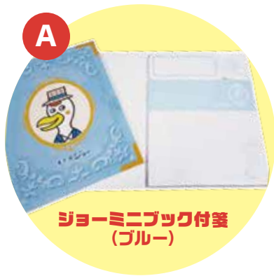
ジョーミニブック付箋 (ブルー)