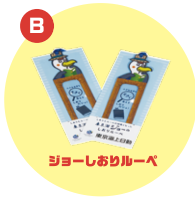
ジョーしおりルーペ